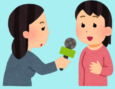
INTERVIEWS BEWONERS & STAKEHOLDERS