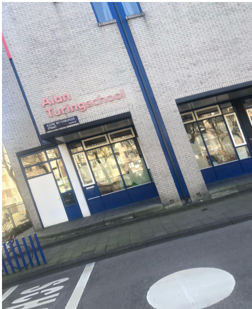
Afbeelding 2: Alan Turingschool gelegen aan het Wittenburgerplein

Tijdens de pauzes is het plein dus gevuld met kinderen en is er veel levendigheid. Het probleem komt tot uiting wanneer de basisscholen 'uit' zijn en de leerlingen naar huis gaan. Op de spelende basisschoolleerlingen na, beschikt het plein niet over andere levendige invullingen voor het resterende deel van de dag.