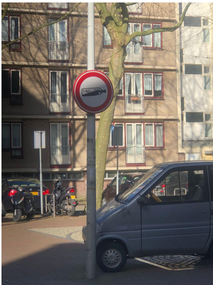
Afbeelding 3: Alcohol verbod op het Wittenburgerplein